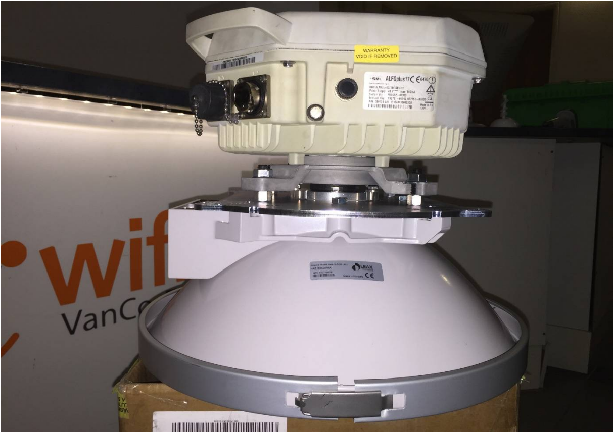
Parabola Arkivator 60cm